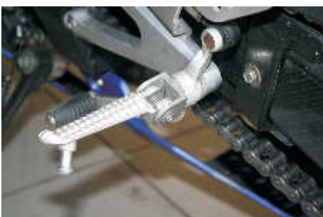
Beispiel Yamaha R1 (RN09)

Our footrest kit then includes the appropriate replacement parts.